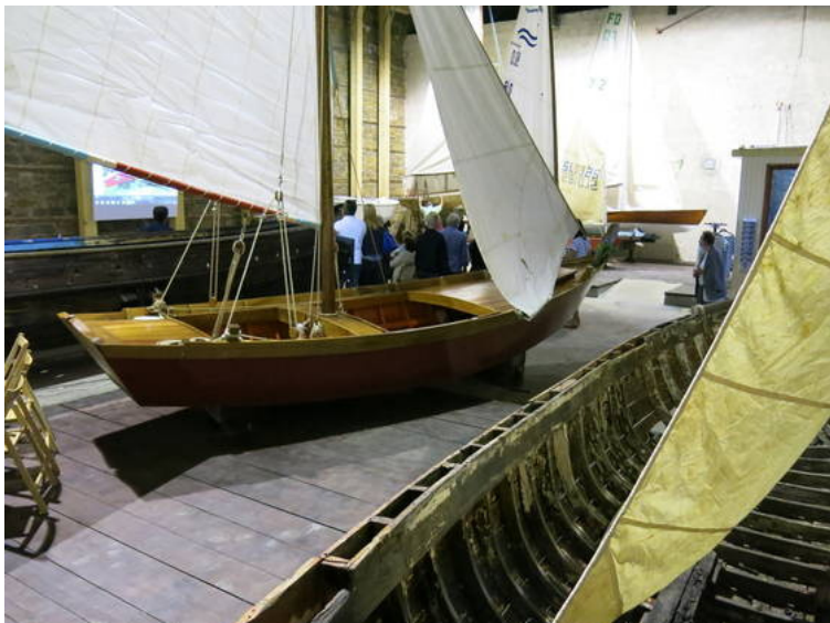
Muzej tradicionalnih plovil bodo obogatili s pomočjo evropskih sredstev.