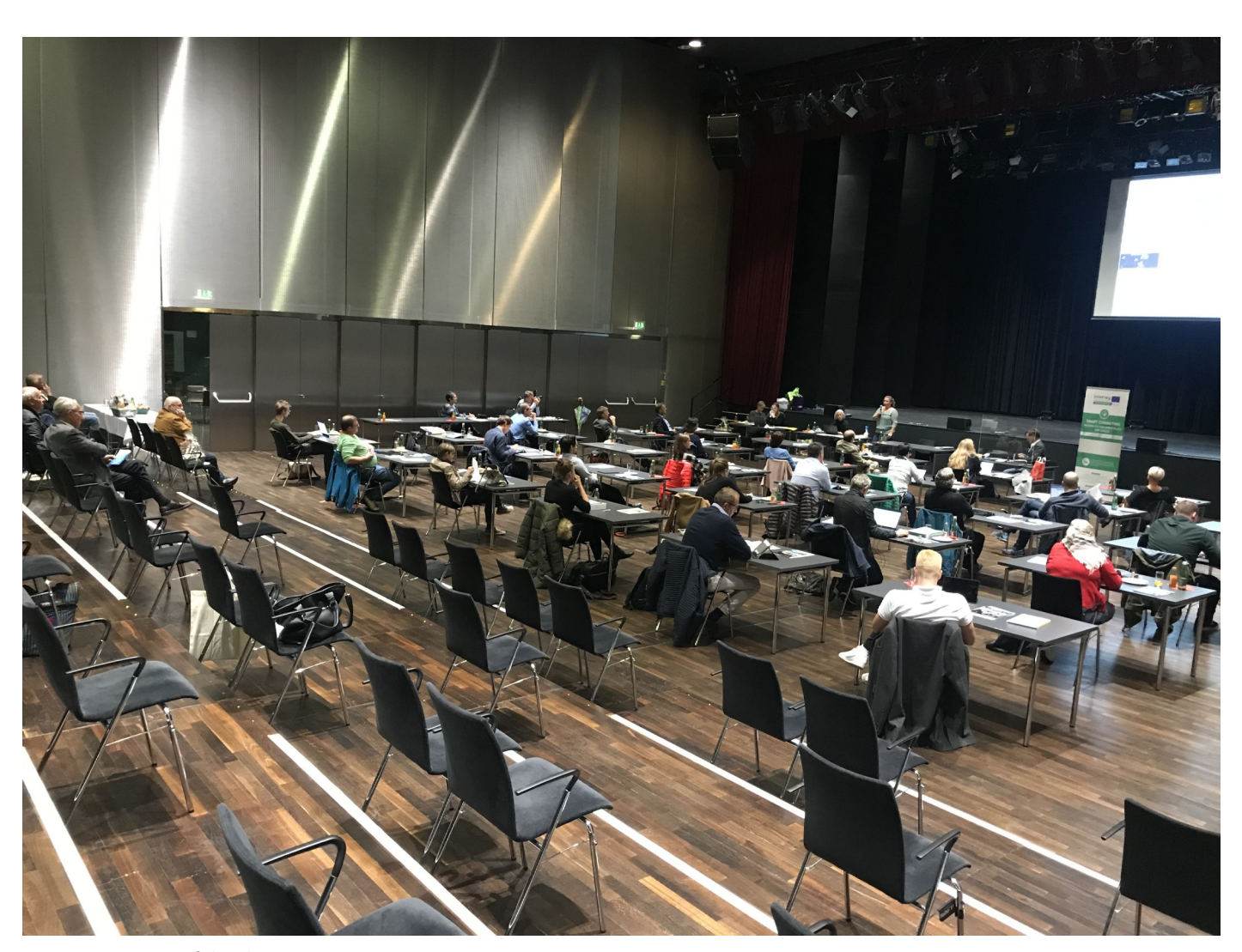
Figure 2 Overview of the plenum