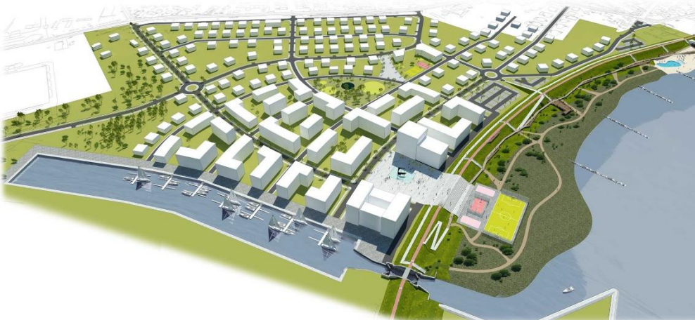
TERENY ZIELONE ZE ZBIORNIKIEM WODNYM - WIDOK ZAGOSPODAROWANIA