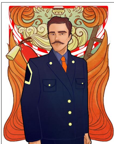
EOC Director