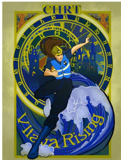
Autorska prava: Rastuća Vltava: Articulated Python/Kimberly Himmer 2019.

ProteCht2save je 19. i 20. rujna 2019. bio prisutan na manifestaciji interact u Valenciji u Španjolskoj koja se bavila filmom „ Kulturno nasljeđe i kreativne industrije: izazovi i rezultati u Interregu ”. Tijekom manifestacije predstavljena je videoigra, koja se razvila kao interaktivni priručnik o najboljoj praksi za općine, osobe koje odgovaraju na izvanredna stanja i pripadnike timova spašavanja kulturne baštine Protecht2save. U CHRT: Rising Vltava igrač će biti zadužen za tim stručnjaka za zaštitu kulturne baštine i mora koordinirati oporavak dragocjenih muzejskih artefakata tijekom scenarija poplave u Pragu. Stručnjaci za kulturno nasljeđe i artefakti zastupljeni u vježbeničkoj igri predstavljaju svaku partnersku zemlju Protecht2Save. Videoigrice uključuje aspekte strategije, igre igranja uloga i igara zagonetke te predstavlja prvi korak prema online i off-site individualnim mogućnostima obuke kako bi se osigurali funkcionalni timovi za spašavanje kulturne baštine u partnerskim zemljama. Da biste saznali više o dizajnu i razvoju igara, a više o dizajnu ozbiljnih igara općenito, idite u www.VltavaRising.com .