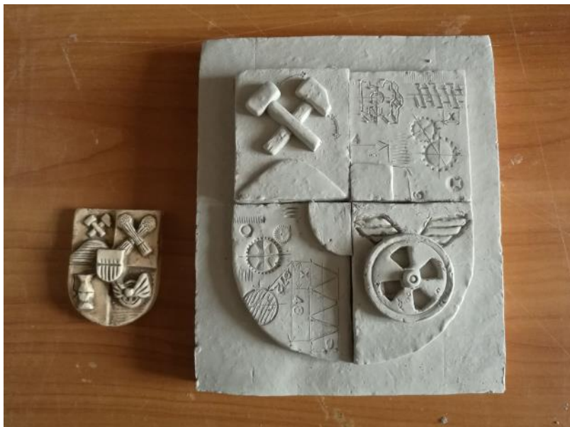
Obrázek 5 Návrh designu Putovní výstavy průmysl se představuje veřejnosti