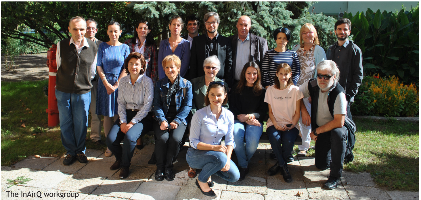
The InAirQ workgroup

Spojená strategie a akční plány budou testovány a použity v rámci koordinace různých skupin zainteresovaných osob včetně místní správy, společnosti a národních /regionálních/ místních úřadů zodpovědných za řízení škol.