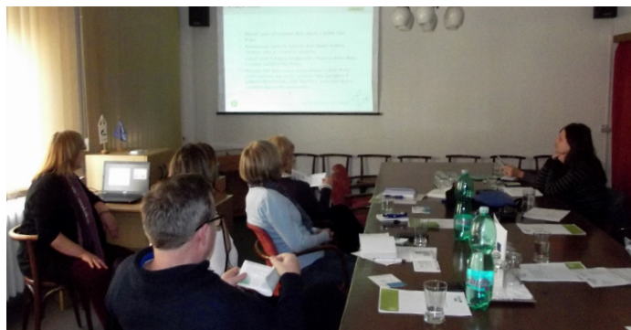
Prague, Czech Republic