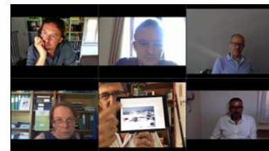
Képernyőkép az online megbeszélésekről, Oltrepò Pavese ICC-k – 2020. augusztus 6.