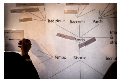
Első, kezdő workshop Olaszországban Agriturismo Mondo Antico Rocca Susella (PV) 2020. szeptember 24.