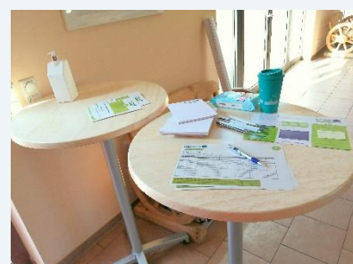
Workshop in Wittbrietzen