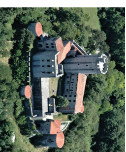
Grad Ribemberk, Mestna občina Nova Gorica, Slovenija - ena od lokacij poskusnih dejavnosti projekta RESTAURA.

Zunanja podpora projektu - Inštitut za evropske projekte Ltd.